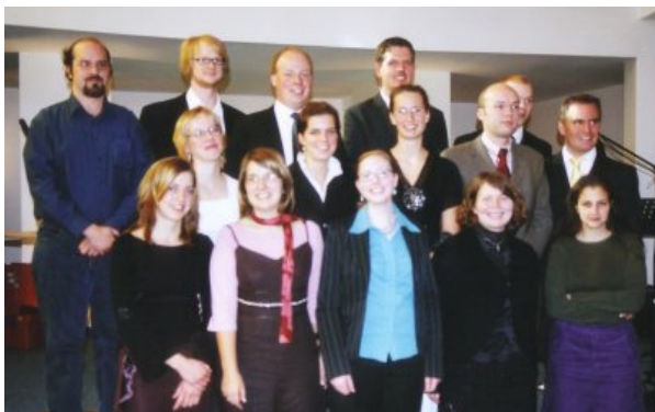
Die Studienanfänger des ersten Semesters im Wintersemester 06/07

Die Theologie kann also schon von ihrer Sache her niemals Selbstzweck sein. Sie hat eine Aufgabe zu erfüllen. Indem sie nämlich nach-denkend auf das Wort Gottes bezogen ist, befragt sie die Sprache des Glaubens auf ihre Wahrheit hin. Konkret: Sie befragt die Sprache der christlichen Gemeinde in