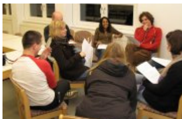
Der Austausch ist eines der wichtigsten Elemente des jährlichen Treffens freikirchlicher Studierender

Berlin bei. Dort besuchte die Gruppe eine Anlaufstelle für Wohnungslose (Notübernachtung der Berliner Stadtmission am Hauptbahnhof) und informierte sich über deren Inhalte und Ziele. Die Erfahrung wurde zum Anstoß für die Frage, ob diakonische Arbeit in erster Linie Mission zum erklärten Ziel haben muss oder in sich selbst einen Wert hat. Trotz mancher Differenzen wurden viele Gemeinsamkeiten deutlich und zahlreiche Vorurteile abgebaut.