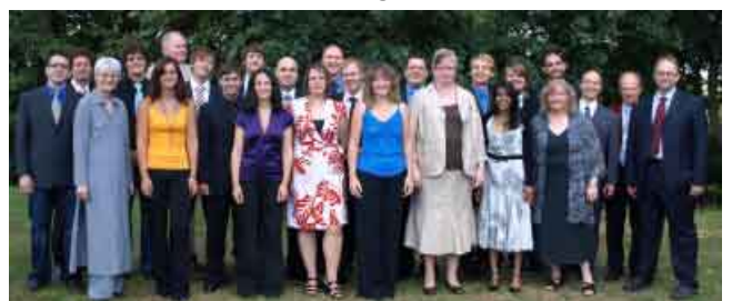
Alle Absolventinnen und Absolventen des Theologischen Seminars