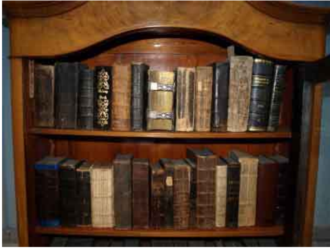
Der Bücherschrank Julius Köbners mit einigen Raritäten