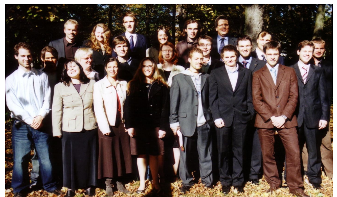
Die Studienanfänger des B.Th., des M.Th. und die Zusatzstudierenden