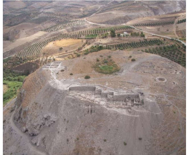
Der Tell Zira'a in Nordjordanien

Der Alltag der Grabung besteht aus einem disziplinierten Tagesablauf, der aufgrund der großen Hitze morgens um 4.30 Uhr beginnt. Mit Werkzeugen wie Spitzhacke und Schaufel werden die Lehmschichten aufgehackt. Schnell entwickelt man beim Schau-